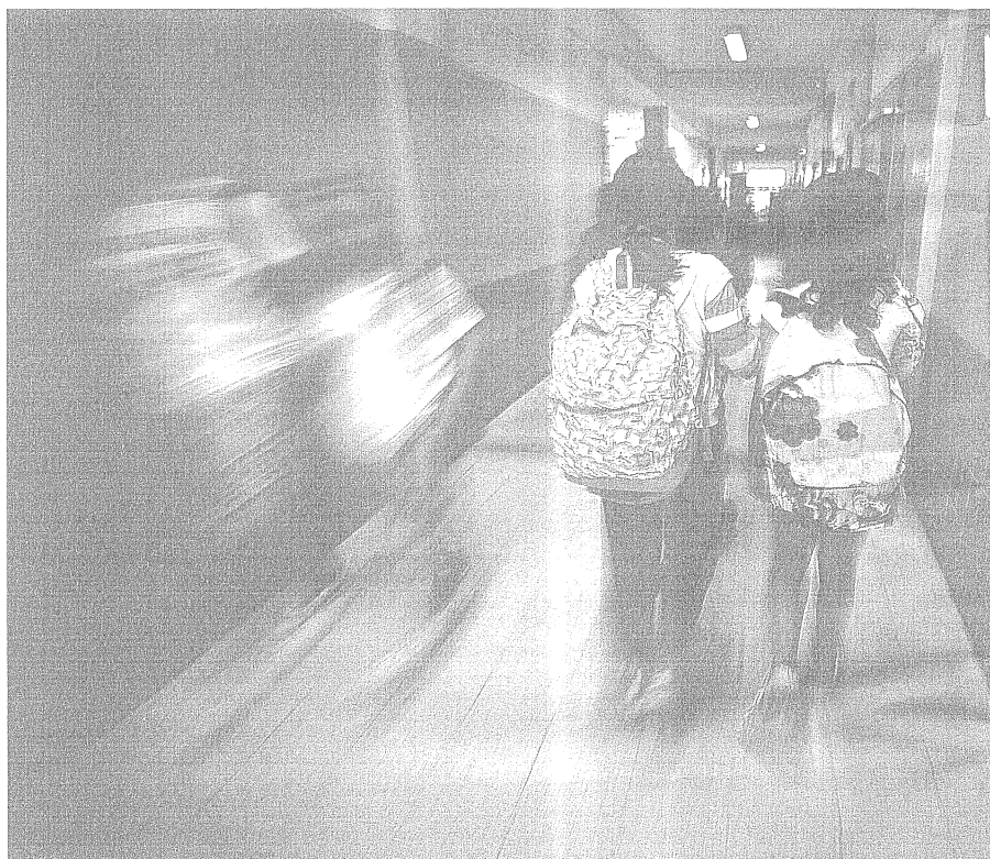
As bases de dados dos exames nacionais têm permitido verificar que quanto mais velhos são os alunos piores

Os valores esperados em cada cluster foram depois calculados para cada ano de final de ciclo, tendo sido levadas em conta variáveis como a idade média dos alunos, a proporção de alunos que não beneficiam de apoios sociais, a percentagem de estudantes do sexo feminino e a média do número de alunos por turma. Segundo a DGEEC, "a variável idade revelou-se como uma das que mais significativamente contribuíram para explicar a variabilidade nos resultados dos alunos". O Conselho Nacional de Educação alertou recentemente para o facto de o desfasamento etário de muitos alunos, em resultado dos chumbos, continuar a ser uma marca do sistema português, tendo apelado a "uma mudança profunda na atitude dos professores e das escolas face ao insucesso dos seus alunos". As bases de dados dos exames nacionais têm permitido verificar que quanto mais velhos piores os resultados obtidos.